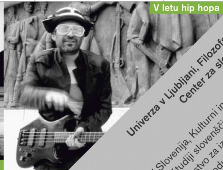
V letu hip hopa

Univerza v Ljubljani, Filozofska fakulteta, Oddelek za slovenistiko, Center za slovenščino kot drugi/tuji jezik Sodelujoči: RTV Slovenija, Kulturni in umetniški programi; tuje univerze, kjer potekajo lektorati in študiji slovenščine; Ministrstvo za izobraževanje, znanost, kulturo in šport Republike Slovenije; Ministrstvo za izobraževanje, znanost, kulturo in šport Republike Slovenije, VPK, producentne hiše: RTV Slovenija, Luksuz produkcija, VPK, za Slovence v zamejstvu in po svetu www.centerslo.net/stu