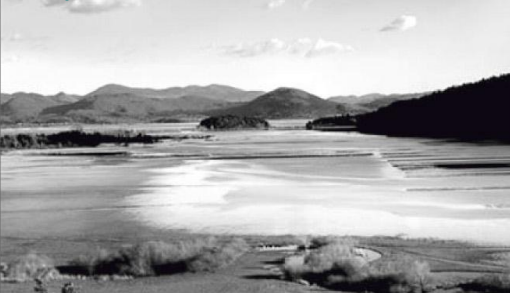
Presihajoče jezero – Zadnji čoln