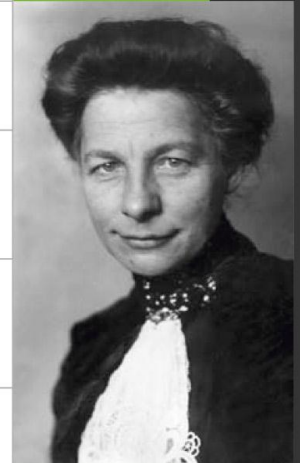
Ivana Kobilca – Portret slikarke